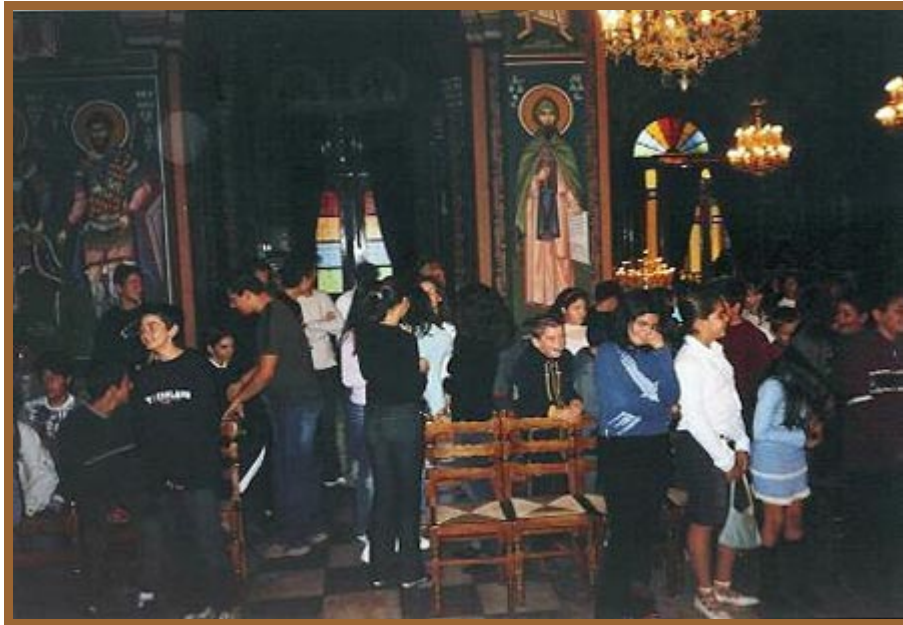
«ΑΝΤΙΔΡΑΣΗ ΤΩΝ ΠΑΙΔΙΩΝ»